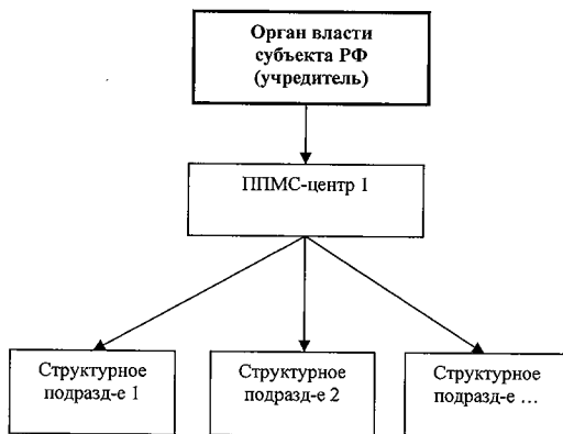
Рис.2. Схема централизованной модели организации деятельности ППМС-центров

В регионе уполномоченным органом власти создается Центр с филиалами, которые распределяются в соответствии со спецификой территориального расположения, численностью детского населения и его потребностью в помощи. Центр представляет собой жесткую иерархическую систему оказания психолого-педагогической, медицинской и социальной помощи. Такая структура позволяет обеспечить высокую централизацию управления, единый стандарт услуг, рациональное использование кадровых и финансовых ресурсов, прозрачность и достоверность результатов деятельности.