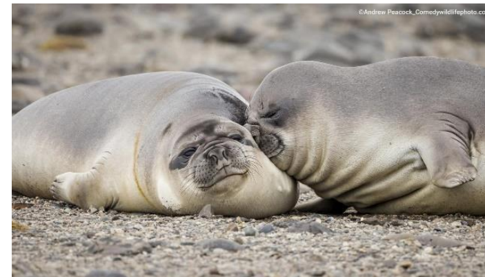
Более 90 лет